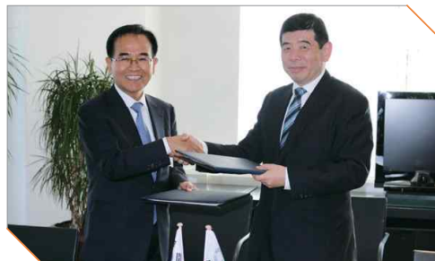
◀ 11일 벨기에 브뤼셀에서 열린 '제73차 WCO 정책위원회 및 제123/124차 총회'에서 김낙희 관세청장이 WTO 무역원활화 협정의 이행을 위한 개도국 능력 배양의 중요성을 강조하고 있다.

이번 회의에서는 지난해 11월 극적으로 합의된 세계무역기구(이하 WTO) 무역원활화 협정(TFA : Trade Facilitation Agreement)의 이행지원 방안과 전자상거래 급증에 대한 대응방안 등 지난 1년간 WCO에서 중점 추진해 온 정책들을 논의했다.