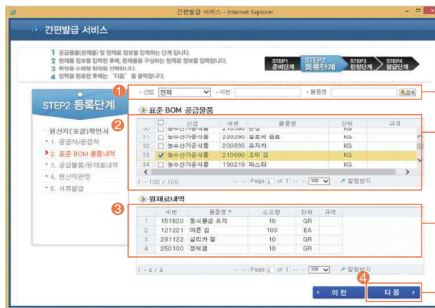
검색조건 입력 - 상업, 세번, 품명 공급물품 선택(예) - 품명 : 조미 김 - 단위 : 1KG 표준 BOM 원재료 확인 다음 버튼 클릭

공급처가 선택되었다면 수출 품목의 세번이나, 품명을 검색조건 입력란에 입력한다. 예를 들어, 김을 수출하고자 한다면 검색조건에 김을 입력하면 물품내역, 품목분류 코드 및 자재명세서 등이 기본사항으로 제공된다.