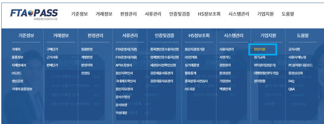
【메뉴 이동 화면】

두번째는 시스템 로그인('기업코드, 아이디, 비밀번호' 입력) 후 메뉴 '기업지원'현장지원'을 클릭한다.